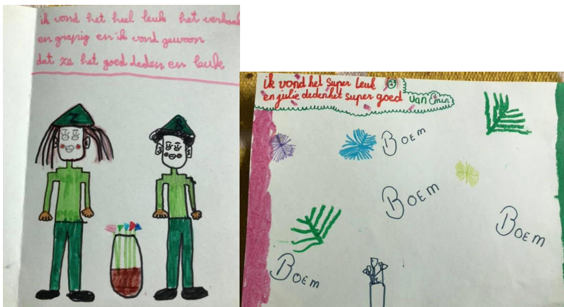
Reacties van kinderen op voorstelling 'Er kwamen twee soldaatjes aan', Careyn Rosendaal Utrecht