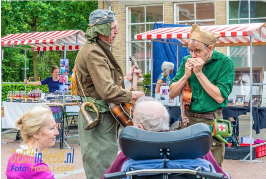
De Sunshine Soldiers zorgen voor een aangenaam muzikaal sfeertje

Het fotoblog DeBiltinBeeld.nl besteedde op 21 juni aandacht aan het optreden van de Sunshine Soldiers tijdens het Mantelzorgfestival.